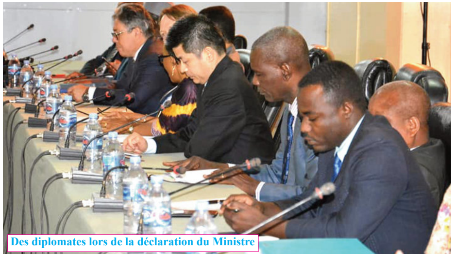
Des diplomates lors de la déclaration du Ministre

Il s'agit donc d'une déstabilisation bien planifiée du Tchad dont l'engagement dans la lutte contre le terrorisme aux