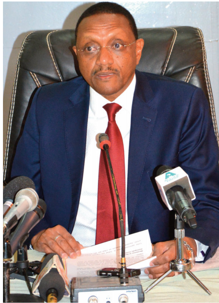
Le Ministre des Affaires Etrangères, Chérif Mahamat Zène face aux diplomates accrédités au Tchad, le 14 février 2019