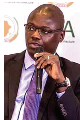
Bégoto Miarom P.9